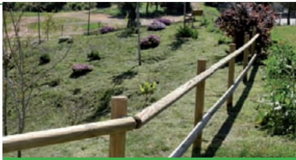
4 18 FESTA DE L'ARBRE PARC L'OREIG