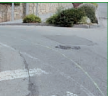
RA VIA CARLES RIBA