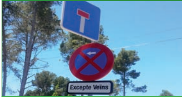
5 SENYALITZACIÓ VIÀRIA