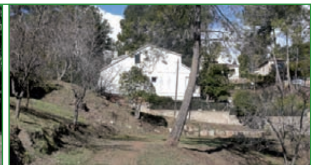
8 FRANGES FORESTALS