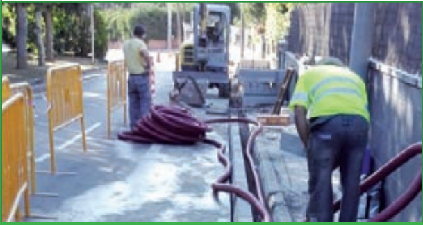
2 2a Fase de VIA PALLEJÀ