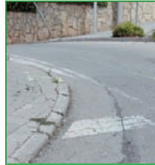
7 OBRA VIA CA