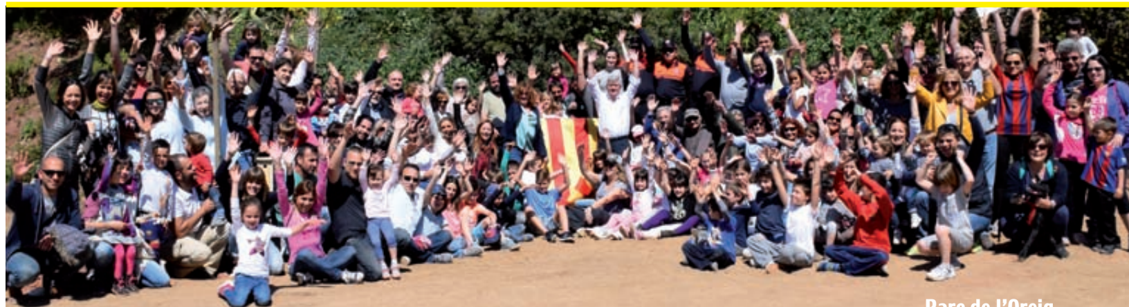
Parc de l'Oreig

El 24 de desembre és ja una tradició que els veïns de Fontpineda, de Pallejà, vénen al Centre Cívic per veure la màgia del PARE NOEL i començar amb alegria les festes de Nadal. L'organització (AAVV./ CMGF), és complexa i necessita molts voluntaris, a tots ells gràcies pel vostre temps i la vostra simpatia!