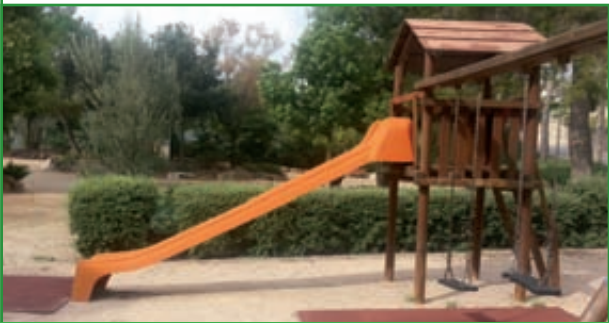
3 PLUVIALS DE PLAÇA DEL CADÍ