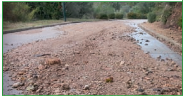
10 MILLOREM LES CARRETERES