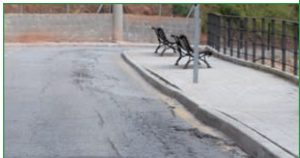
9 VIA ALEGRIA EN MARXA