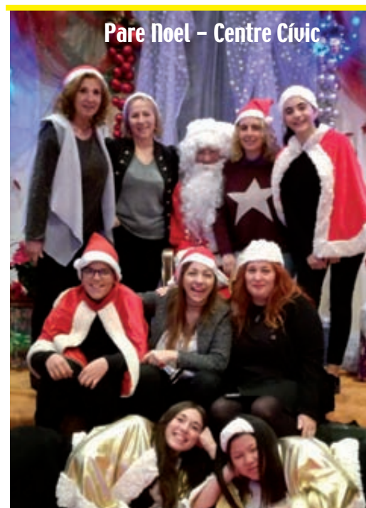
Pare Noel - Centre Cívic