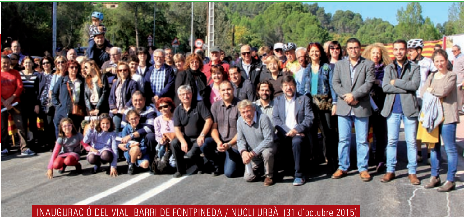
INAUGURACIÓ DEL VIAL BARRI DE FONTPINEDA / NUCLI URBÀ (31 d'octubre 2015)

L'obra de connexió entre el barri de Fontpineda i el nucli urbà de Pallejà va començar a finals de maig de 2015 . La infraestructura, llargament reclamada (des del 2002) pels veïns de Fontpineda i pels comerciants del nucli urbà, va ser inaugurada el 31 d'octubre de 2015 . Aquest projecte va ser un dels objectius prioritaris de la legislatura (2011-2015).