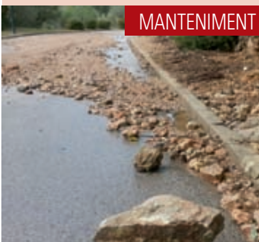
MANTENIMENT DE LES ENTRADES AL BARRI

Cada any destinem més de 70.000 euros al manteniment dels espais públics i enjardinats. Aquest manteniment és d'urgència quan tenim una forta tempesta a la zona. A la fotografia podem veure les conseqüències que tenen les tempestes a la carretera de la Palma de Cervelló.