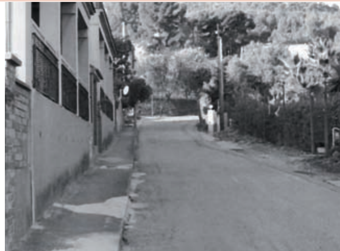
ABANS I DESPRÉS DE L'OBRA

Municipis del Baix Llobregat i de comarques veïnes hem unit esforços per tractar el tema de la qualitat de l'aire. Després d'informes i experiències conjuntes, es crea una comissió que servirà com a espai de debat i treball contra la contaminació atmosfèrica. Vuit poblacions (Pallejà entre elles) estan incloses en la ZONA DE PROTECCIÓ ESPECIAL/AMBIENT ATMOSFÈRIC.