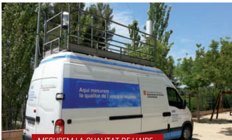
MESUREM LA QUALITAT DE L'AIRE

La feina feta pel govern municipal de PDF i CDC no va ser gens fàcil. Van ser necessaris més de tres anys per dur a terme un projecte assumible econòmicament i tècnicament. Vam fer 10 expropiacions de les finques afectades i la modificació del Pla General Metropolità. L'obra, amb un pressupost final de més d' 1.125.000 euros s'ha acabat de pagar recentment.